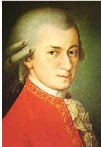
MOZART, WOLFGANG AMADEUS (1756 - 1791)