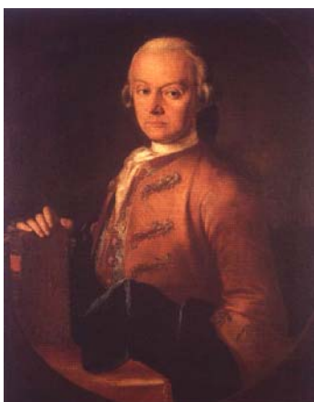
Leopold Mozart, pai de Wolfgang

O Vós, que ora estais ingressando em um novo grau de consciência, caminhai firmes sobre vossa senda, é a trilha, sabeí, da sabedoria. Somente o homem infatigável pode se aproximar à fonte de Luz. Recebei, peregrinos, a vossa acolhida e a bênção dos vossos irmãos! A prudência esteja sempre ao vosso lado; o anseio de conhecer guie os vossos passos! Usai o vosso juízo e não sejais, nunca mais, vítimas da cegueira dos defeitos! Duro é o caminho da vida, mas doce é verdadeiramente o prêmio que aguarda o caminhante que, sabiamente, sabe desfrutar de sua viagem. Feliz daquele que um dia poderá dizer: Há Luz sobre o meu caminho!