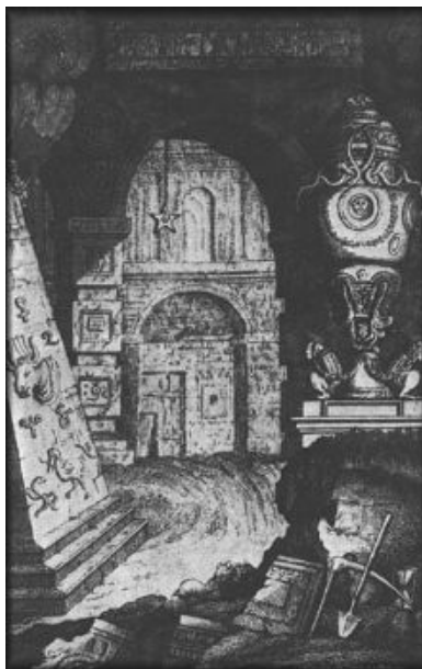
Página do libreto original de “A Flauta Mágica”

“Salve sagradas criaturas que se impõem através da noite! / Agradecimentos a vós, Osíris e Ísis, sejam apresentados! / A força venceu, e como recompensa / Apresenta a eterna coroa à beleza e à sabedoria.”